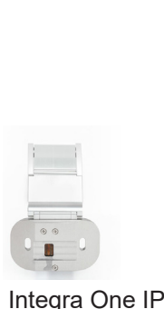
Integra One IP